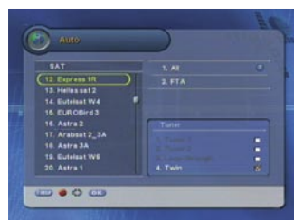
Popis satelita |