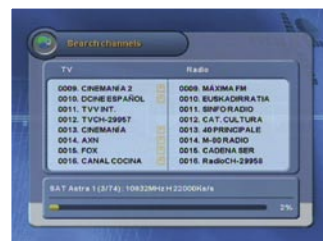
Pretraga satelita |