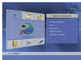
Glavni izbornik |