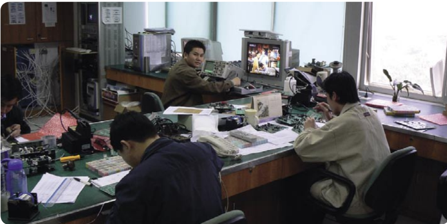
Bez testnih primjeraka se ne može. Ovdje se prave i testiraju prototipi.