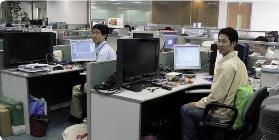
Izgled radnog mjesta jednog projektanta softvera