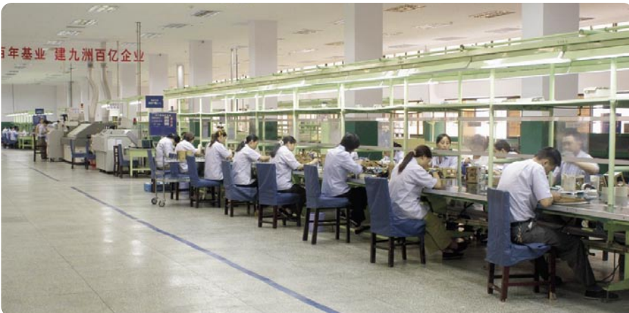
Proizvodnja: na slici je dio montažne trake za satelitske prijemnike.