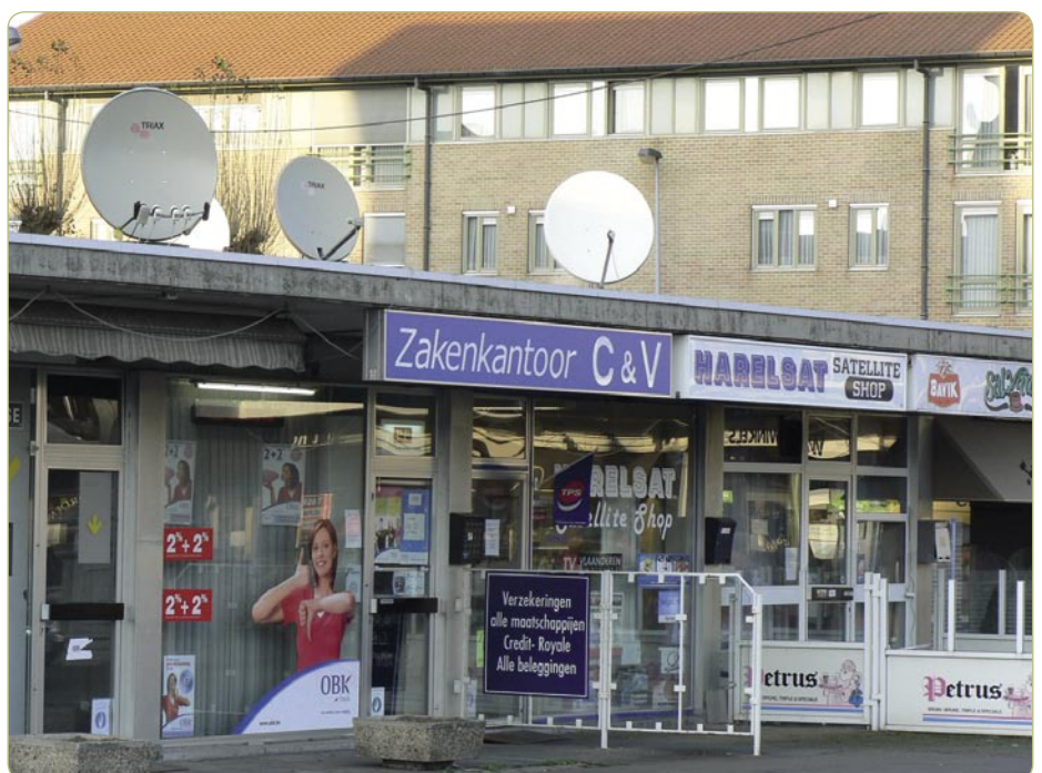
Mala prodavnica „Harelsat“ – otvorena od utorka do subote od 9-19 h – u kojoj se mogu kupiti satelitski kompleti i oprema.

Klub BSH je u prošlosti organizirao i neke sajmove: na posljednjem, održanom 2006. godine okupilo se više od deset izlagača i preko 500 posjetitelja. Sljedeći je zakazan za svibanj 2007. godine, u prostoru koji će omogućiti učešće 20 izlagača. Sve ovo govori u prilog činjenici da je belgijsko tržište, usprkos svojoj skromnoj veličini, i te kako živo i akti-