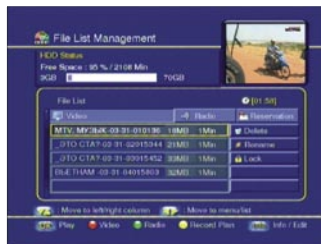
Izbornik za rad sa snimkama