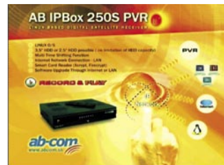
Podrazumijevani zaslon dobrodošlice