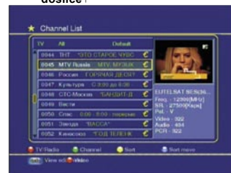
Popis kanala na satelitu SESAT na 36° istočno