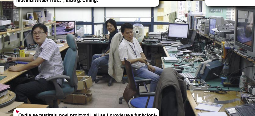
▼ Ovdje se testiraju novi proizvodi, ali se i provjerava funkcioniraju li uređaji sa tvorničke trake u skladu sa specifikacijama.