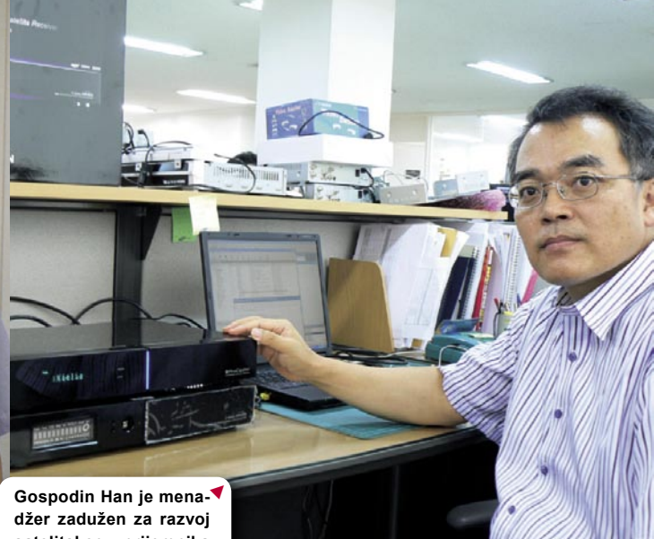
▼ Gospodin Han je menadžer zadužen za razvoj satelitskog prijemnika visoke razlučivosti HD 4000 koji predstavljamo u ovom broju TELE-satelita.