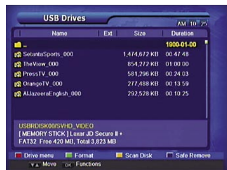
PVR List |