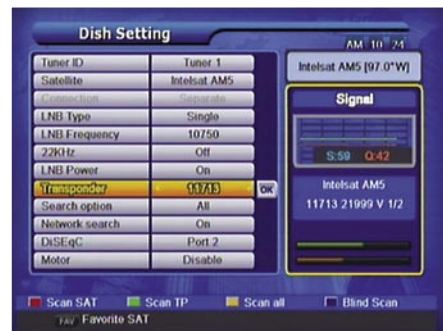
Podešavanje antene |