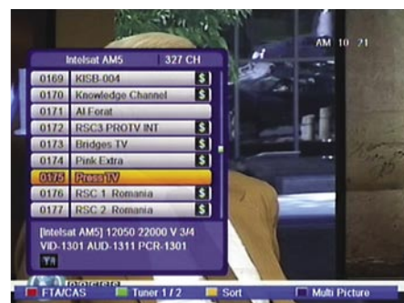
Popis kanala |

Uređaj posjeduje i veliki broj drugih korisnih funkcija poput prikaza slike u slici (PIP). Možete ga koristiti i kao MP3 player i preglednik JPEG slika, što znači da imate priliku impresionirati svoje prijatelje i rođake svježim fotografijama s ljetovanja.