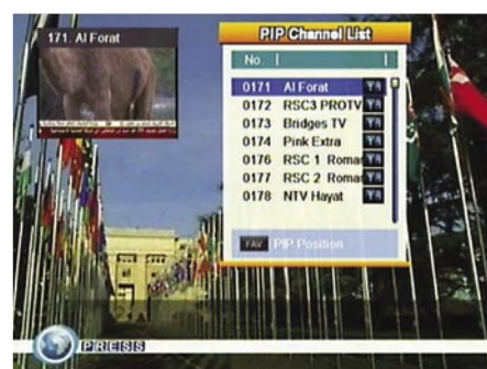
PIP popis kanala |